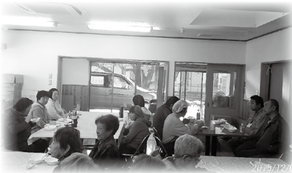
保健センター合同クッキング (平成27年12月)

9名の利用者が日々の内職的作業をやりながら、一生懸命育てたり制作したりして販売をしておりますので暖かく見守って頂ければ幸いです。