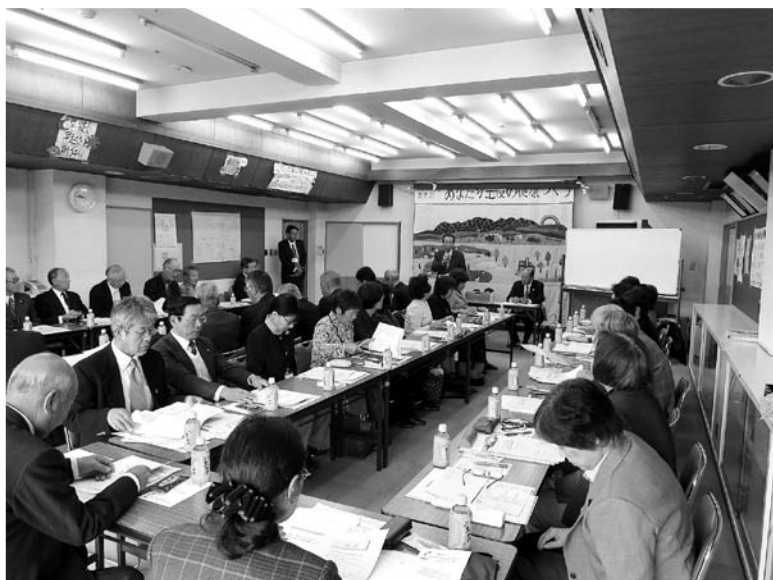
社会福祉協議会役員研修 (平成27年10月29日)