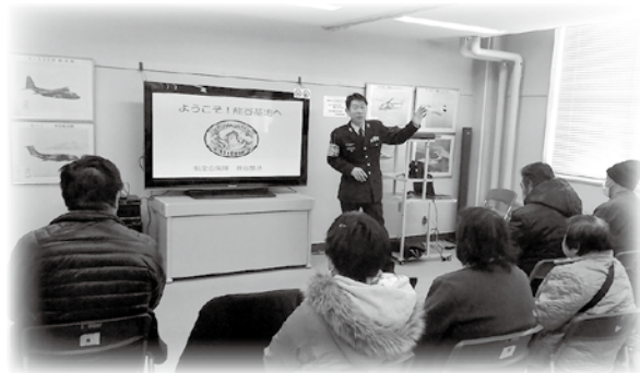
職場見学 (平成28年2月)

今年は、航空自衛隊熊谷基地に行きました。隊員の方々と一緒に昼食をとることができ、とても嬉しかったです。