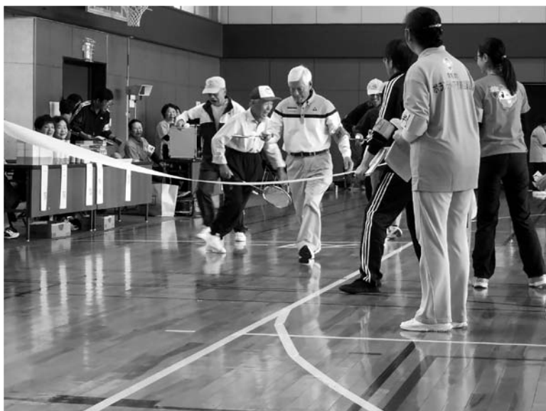
総合福祉スポーツ大会 (平成27年10月24日)

編集発行 社会福祉法人 明和町社会福祉協議会 明和町新里 311-3 明和町老人福祉センター内 TEL.0276 (84) 4013 FAX.0276 (84) 4904 http://www.meiwa-syakyo.or.jp/