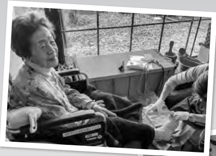
▲健康ひろばの様子▶

各団体の商品も、お昼にはほとんどが売り切れ、抽選会にも多くの方にご参加いただきました。ふるさとの広場で開催されたマルシェには、アクセサリーや雑貨などの販売ブースに加え、キッチンカーが大集合しました！また、マルシェを盛り上げるステージでは、和太鼓や、手話うた、ダンスなど、7組がパフォーマンスを披露し、大変にぎやかなマルシェとなりました。多くの方にご来場いただき、全体で約3,000名以上の方が遊びに来てくれました。